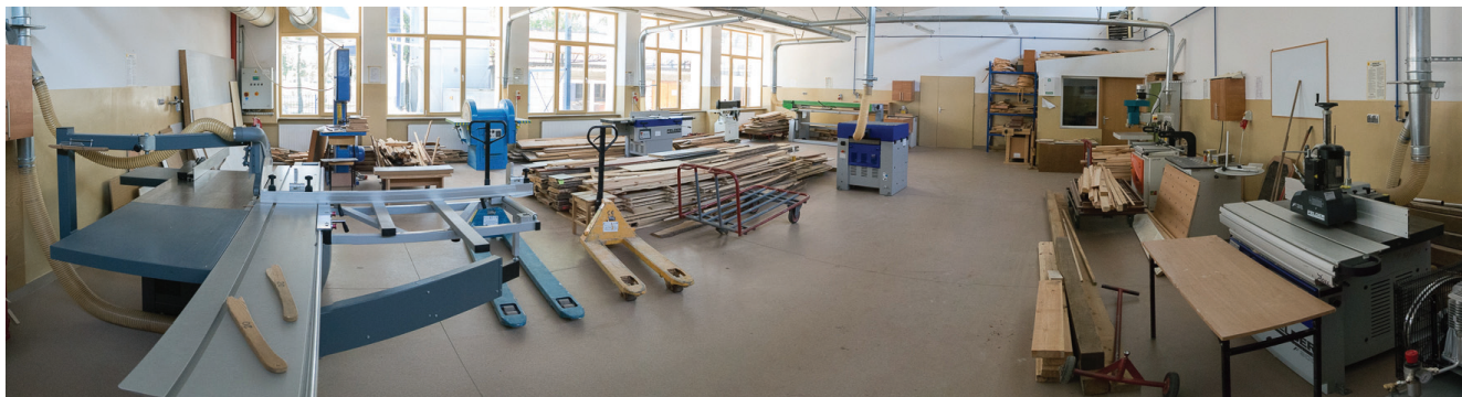
Warsztaty w Zespole Szkół Budowlanych w Olsztynie.

Zapraszamy do udziału w specjalnym programie - Zawodowcy z Olsztyna. Oprócz promocji szkół zawodowych i prezentacji ich oferty, uczniowie gimnazjów mają szansę na wygranie cennych nagród (konsole X-Box, tablety, sprzęt audio). W każdej szkole gimnazjalnej 20 kwietnia, czyli po zakończeniu cyklu, odbędzie się test na MOODLU, którego finaliści zaprezentują się na wielkim finale 23 kwietnia w Hali Urania w Olsztynie. Transmisja na żywo! Całe wydarzenie będzie połączone z promocją szkół i ich oferty.