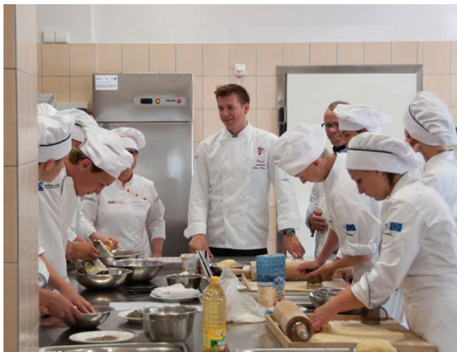
Zajęcia w Zespole Szkół Gastronomiczno-Spożywczych