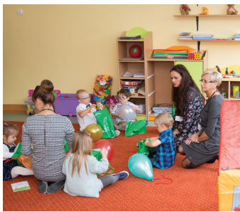
Przedszkole Miejskie nr 8