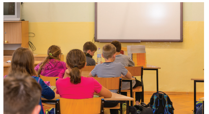
Szkoła Podstawowa nr 2

W szkole wyremontowano pomieszczenie wychowania wczesnoszkolnego. W klasie znajdują się kolorowe meble, nowe ławki i krzesła. Pracownia wyposażona została w nowoczesny sprzęt multimedialny. Pojawiły się również nowe pomoce dydaktyczne. W tym roku szkolnym zajęcia gimnastyki odbywają się w odświeżonej salce wyposażonej w nowy sprzęt sportowy. Wyremontowana została również świetlica, która została dodatkowo wyposażona w "multimedialny dywan" - sprzęt do zabaw i gier interaktywnych. Koszt inwestycji - ponad 30 tys. zł