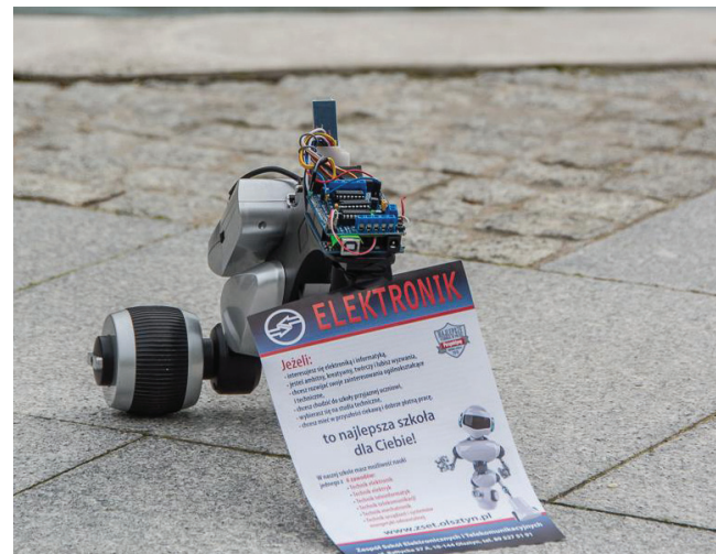
Nauka nowoczesnych technologii w Zespole Szkół Elektronicznych i Telekomunikacyjnych