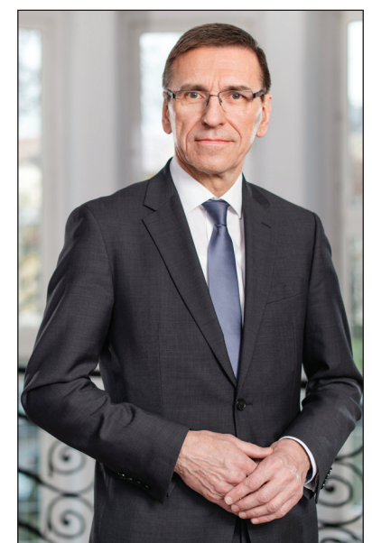
Piotr Grzymowicz prezydent Olsztyna

Przyszłość naszego miasta w ogromnym stopniu zależy od przyszłych pokoleń. Dlatego stwarzamy dzieciom i młodzieży jak najlepsze warunki do zdobywania wiedzy i podnoszenia umiejętności. Wprowadzenie nowych rozwiązań, będących konsekwencją edukacyjnej reformy, wymagało niemałego wysiłku. Ciągłe pracujemy też nad rozbudową bazy. Z budżetu miasta finansujemy tworzenie nowych sal chemii, fizyki, poza tym stołówek, szatni, świetlic. Zdobywamy dofinansowania z zewnątrz na duże modernizacje, jak zaplanowane do realizacji w tym roku termomodernizacje Przedszkola Miejskiego nr 14, Zespołu Szkół Ogólnokształcących nr 1, Zespołu Szkół Mechaniczno-Energetycznych oraz bursy przy Zespole Szkół Budowlanych. Takich zdań jest o wiele, wiele więcej.